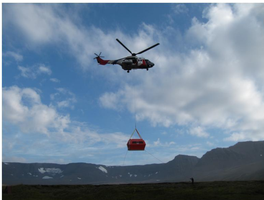
Neyðarskýli flutt norður í Hlöðuvík í september 2010