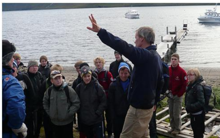
Ungur nemur, gamall temur, skýrsluhöfundur með fræðslustund á Hesteyri

Auk almennra starfa sem friðlandinu fylgja eru unnin verkefni sem tilheyra annarri starfsemi Umhverfisstofnunar, s.s. skipulag og framkvæmd landvarðarnámskeiðs, yfirlestur frummatsskýrslna vegna verkefna tengdum Vestfjörðum, matsáætlanir o.fl. auk ýmissa verkefna sem næstu yfirmenn leggja fyrir.