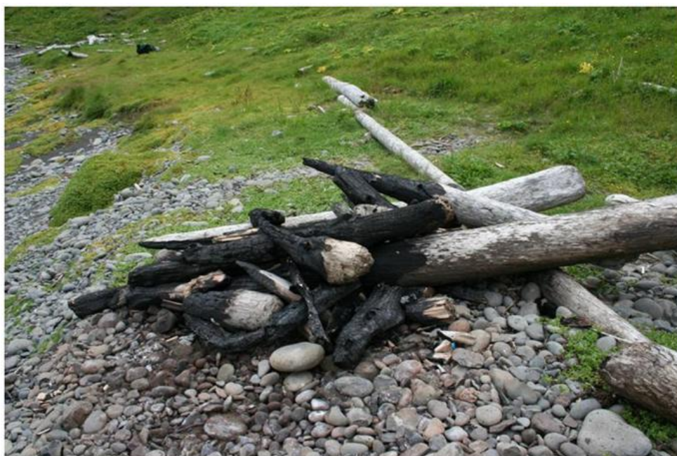
Slæm ummerki eftir varðeld

Á hverju vori má sjá meiðaför eftir snjósleða innan friðlandsins. Svo virðist sem sumir öikumenn taki ekki tillit til snjólausra svæða og aki yfir þau með tilheyrandi skemmdum á gróðri. Setja þarf reglur um akstur vélsleða á svæðinu. Sama á við um fjórhjól, en einstaka eigendur telja tækin til langferða og fara víðar en heimild er til.