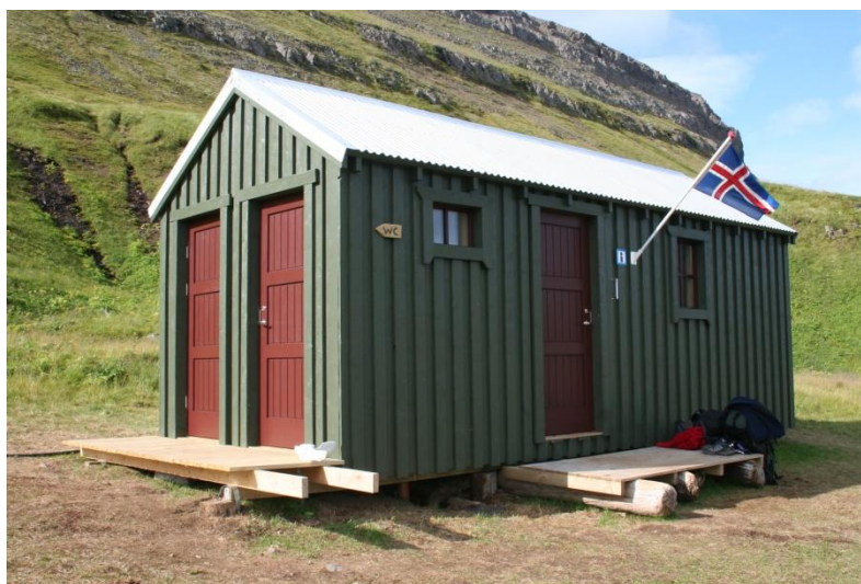
Þjónustuhús, Höfn, Hornvík

Ferðamenn sækja mjög að því, ekki síst til að sækja upplýsingar um veðurfar, gönguleiðir o.fl. Tækifærið var nýtt og fengu ferðamenn auk þess upplýsingar um náttúruvernd, stöðu svæðisins og nauðsyn góðrar hegðunar í samskiptum við náttúru þess. Fræðslugildi hússins var því ótvírætt. Setja þarf fram áætlun um þann þátt, enda húsið gott verkfæri til þess að stýra hegðun gesta á svæðinu.